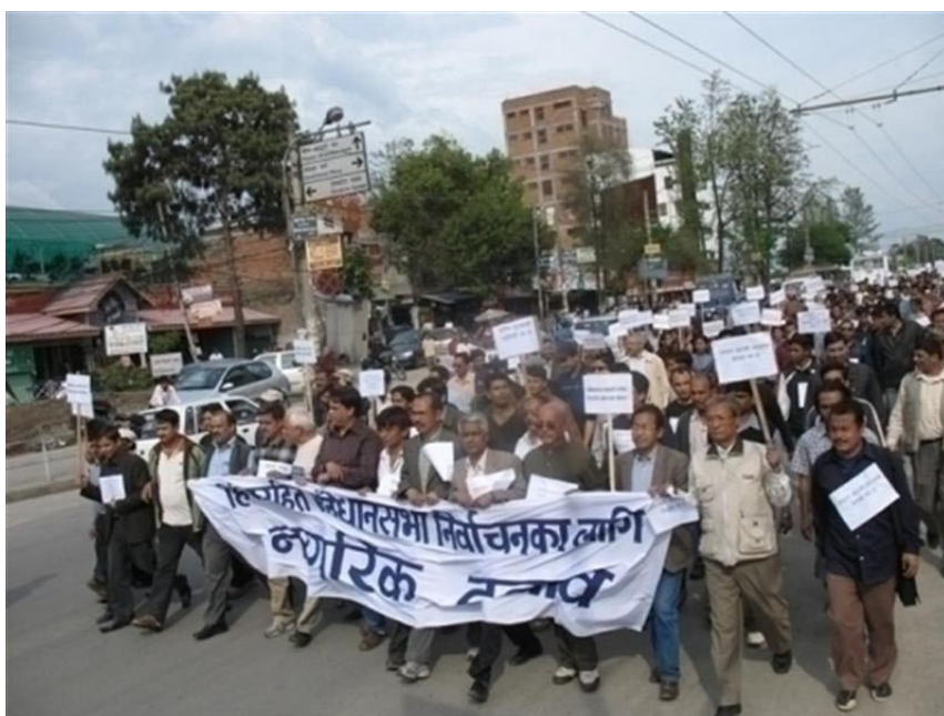
--- Oproep tot vreedzame verkiezingen ---

Voormalig premier en Nepali Congress éminence grise Sher Bahadur Deuba heeft de internationale gemeenschap opgeroepen de uitslag van de verkiezingen in gebieden waar de maoïsten met geweld de verkiezingen trachten te beïnvloeden, niet te accepteren.