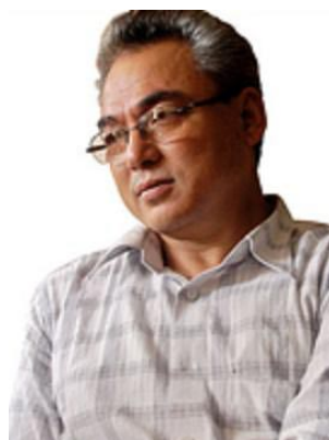
Minister van Defensie Thapa

Zijn de PLA strijders wel geschikt als 'gewone' soldaat? Zijn ze niet teveel politiek verbonden met de Maoïsten? Dat ze kunnen schieten is bewezen, maar op wie?